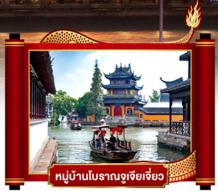
หมู่บ้านโบราณจูเจียเจี๋ย