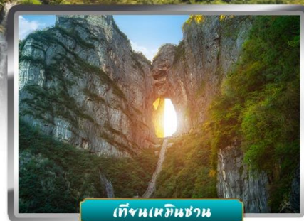
เทียนเหมินชาน