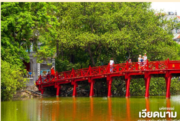
มณฑลจอร์เจีย เวียดนาม ฮานอย • ซาปา • ฟานซิงัน • นิงห์ฮิงห์