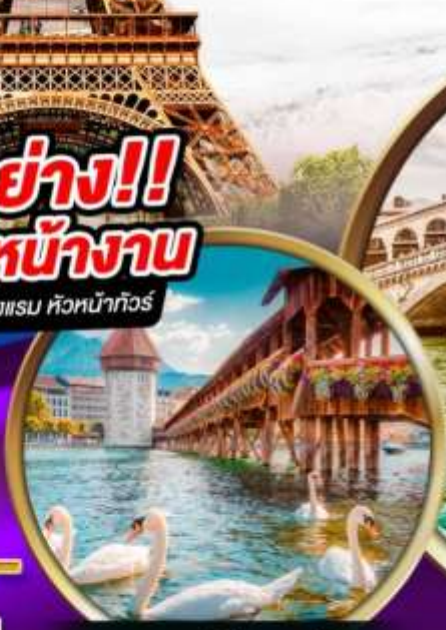
สะพานไม้ ชาเปล