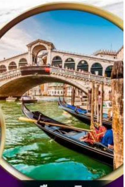
เมืองเวนิส