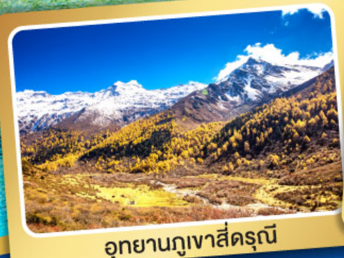
อุทยานภูเขาสั้ดรุณี