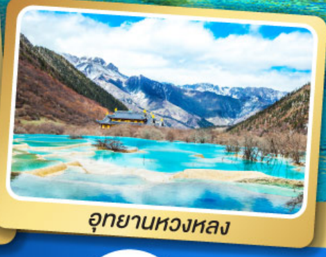
อุทยานหองหลง