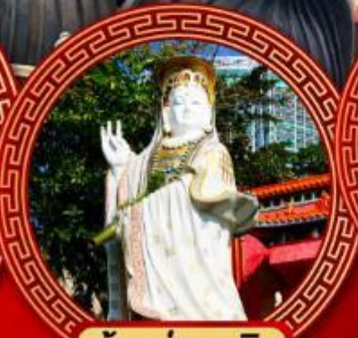
เจ้าแม่กวนอิม รพีลส์เบย์