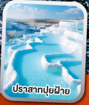
ปราสาทปูยฝ้าย