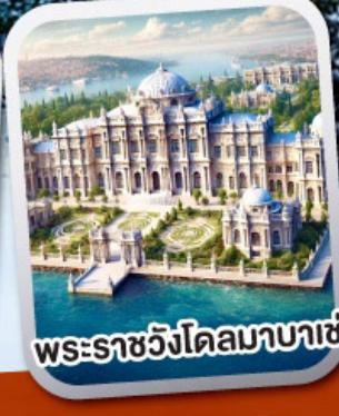
พระราชวังโดลมาบาเซ่