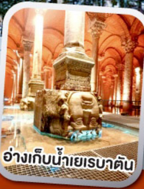
อ่างเทีบน้ำเยรบาตัน