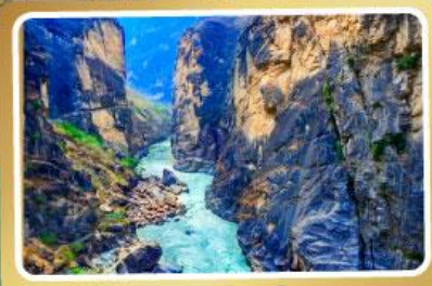
ช่องแคบเสีจอร์โจน