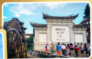
เมืองเก่าลี่เจียง