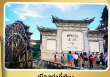
เมืองเก่าลี่เจียง