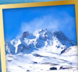
ภูเขาไฟเออซีเยส์