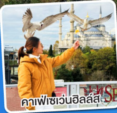
คาเฟ่เซเวนฮิลล์ส

ฟรี!! พวงกุญแจ Evil Eye ชาแอปเปิ้ล,ไอศกรีมมาโก