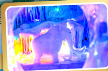
ตำนานแห่งหลงกง