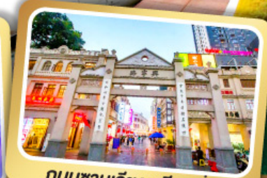
ถนนชานเจียงเหลียงเซียง