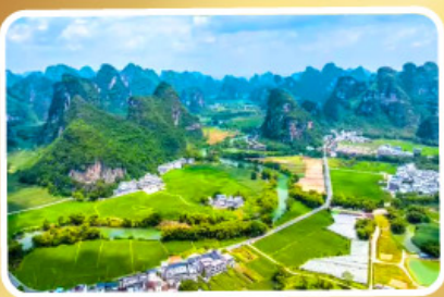
หมู่บ้านหมิงซื่อ