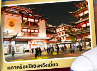
ตลาดรอยปีเต็งหวงเหมียว