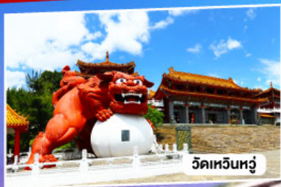
วัดเหวินทง

อาลีซาน ทะเลสาบสุริยันจันทรา จิวเฟิ่น 5วัน 3คืน