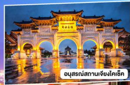
อนุสรณ์สถานเจียงโคเช็ก