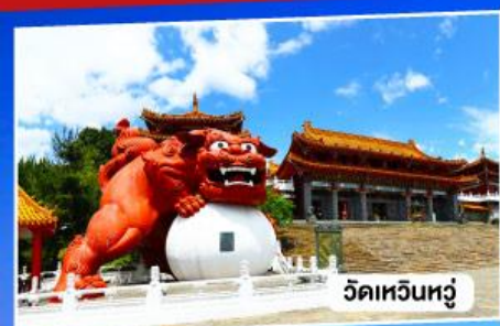
วัดเหวินหู่

อาลีซาน ทะเลสาบสุริยันจันทรา จั๋วเฟิ่น 5วัน 3คืน