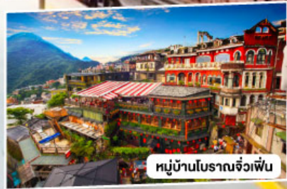
หมู่บ้านโบราณจิวเฟิ่น