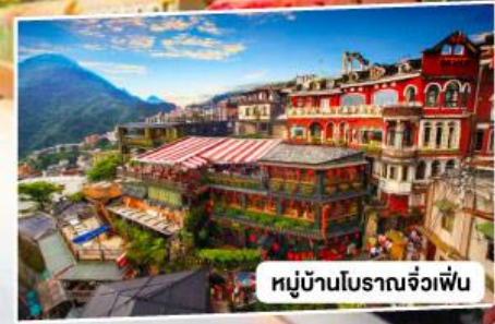
หมู่บ้านโบราณจั๋วเฟิ่น