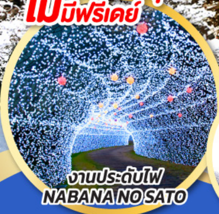
งานประดับไฟ NABANA NO SATO