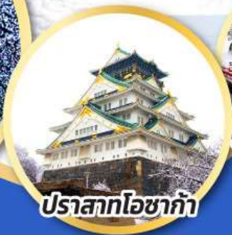
ปราสาทโอซาก้า