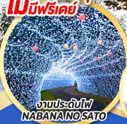
งานประดับไฟ NABANA NO SATO