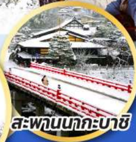
สะพานนากะบาชิ