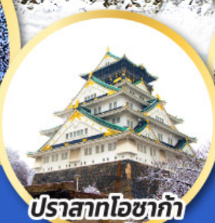
ปราสาทโอซาก้า