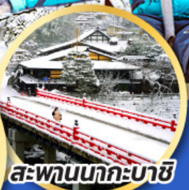
สะพานนากะบาชิ