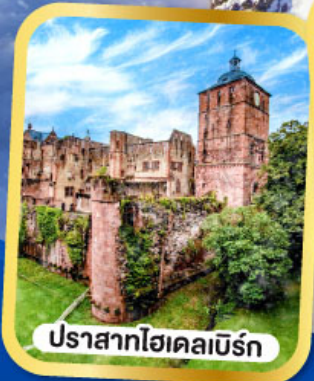
ปราสาทไฮเคลเบิร์ก