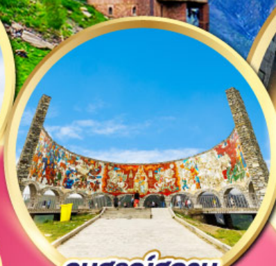
อนุสรณ์สถาน รัสเซีย-จอร์เจีย