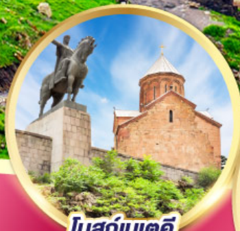
โบสถ์เมเดค