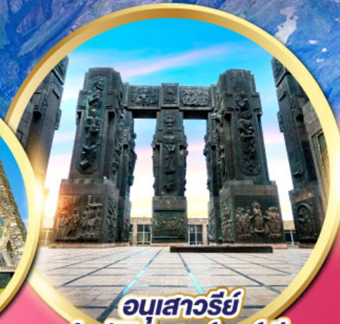
อนุสาวรีย์ ประวัติศาสตร์จอร์เจีย