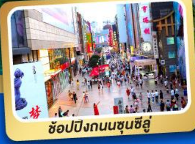
ช้อปปิ้งถนนชุนชิว