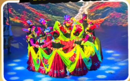
โชว์ทิเบต