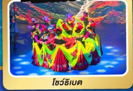
โชว์ทิเบต