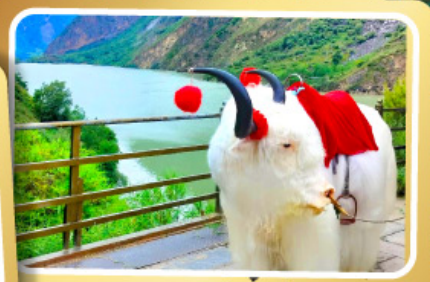
ทะเลสาปเตี้ยซี