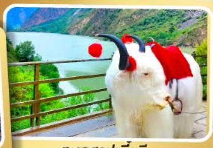
ทะเลสาปเตี้ยซี