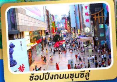
ช้อปปิ้งถนนชุนซีลู่