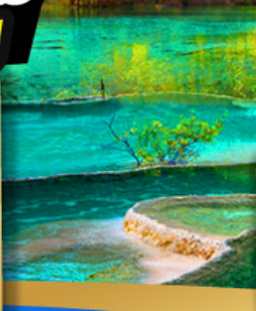
เริ่มต้น