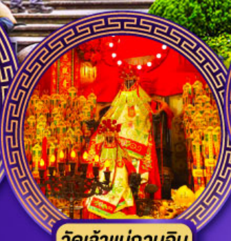
วัดเจ้าแม่กวนอิม ฮองฮ่า