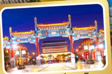
ถนนโบราณเทียนเหมิน