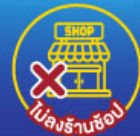
ไม่จําหน่ายช้อปปิ้ง