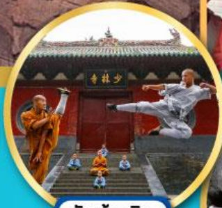
วัดเส้าหลิน ตำนานกังฟู