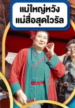
แม่ใหญ่หวัง แม่สื่อสุดไวรัล