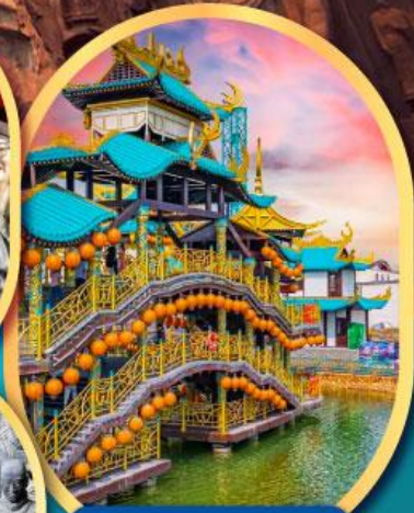
เหวว่านชู่ซาน นครจอมยุทธ