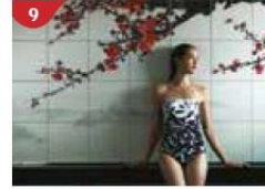
9 Crystal Life™ Spa Rejuvenate mind, body and soul with our holistic Western and Asian spa experience.