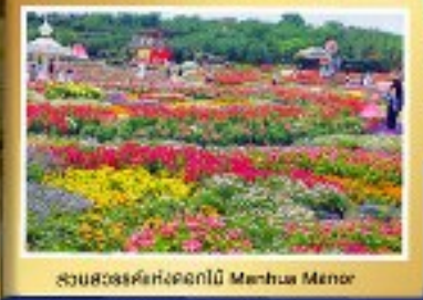
สวนสวรรค์ดอกไม้สีฤดู Mianhua Menor