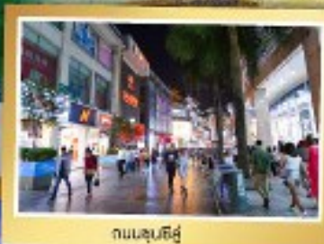
ถนนชุนชี่