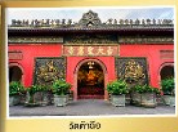
วัดต้าเจี๋ย