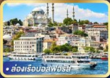
• ส่องเรือบอสฟอรัส