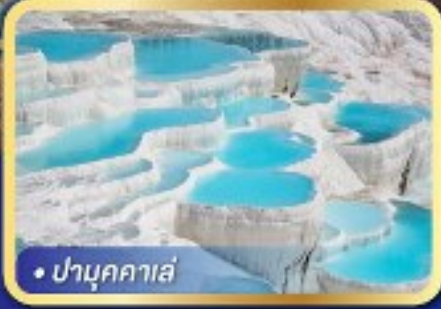
• ปามุกคาเล่