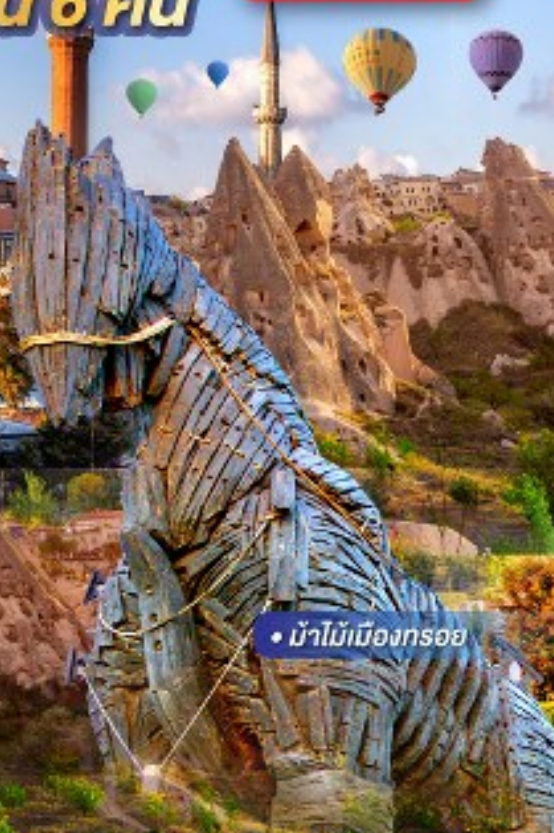
• ม้าไม้เมืองทรอ