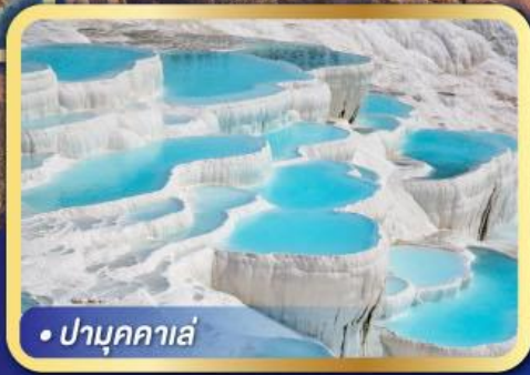
• ปามุกคาล่