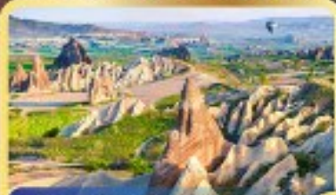
• หุบเขานกฟีนิกซ์