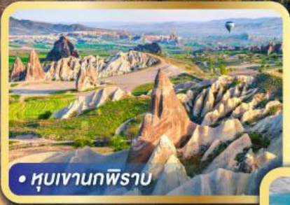
• หุบเขานกพิราบ