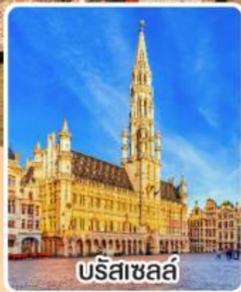
บรีสาชลส์