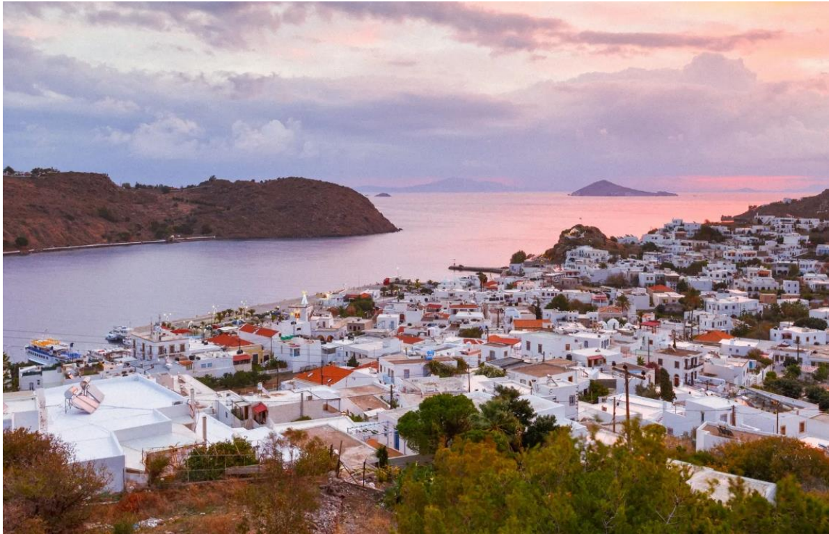
เข็คอินที่ท่าเรือ Piraeus (Athens ) , Greece