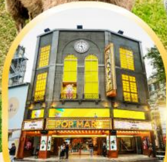
POP MART ใหญ่ที่สุดในไต้หวัน