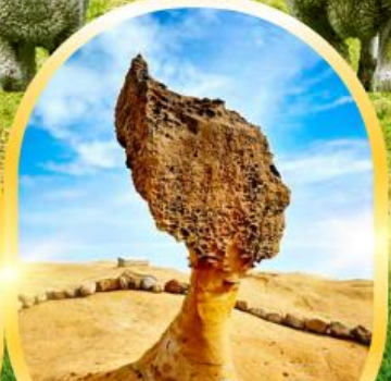
อุทยานแห่งชาติ เย่หลิว