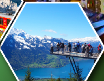
ยอดเขาอาร์ดอร์คคุม

พักเมืองเซอร์แมท เมืองตากอากาศระดับโลก ที่มีฉากหลังเป็นยอดเขามัตเตอร์ฮอร์น ราคาเริ่มต้น