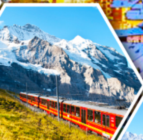
ยอดเขาจุงเฟรา