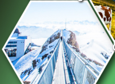
ยอดเขากลาเซียร์ 3000