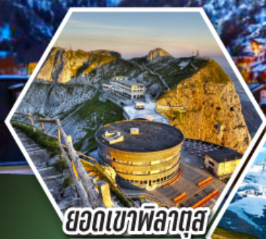
ยอดเขาพิลาตุส