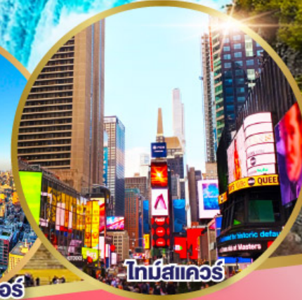
ไทม์สแควร์