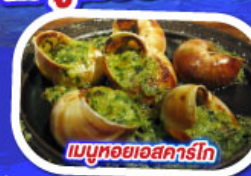
เมนูหอยแอสคาร์โท