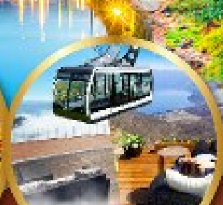
นังกระเช้าอุซุซัง

พิเศษ!! บุฟเฟ่ต์ร้าน NANDA ดีที่สุดในซัปโปโร