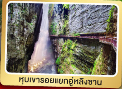
หุบเขารอยแยกอู่หลิงซาน