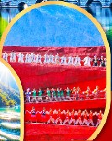
โชว์ Impression Lijiang