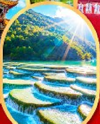
หุบเขาสีน้ำเงิน