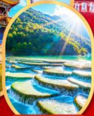
หุบเขาสีน้ำเงิน