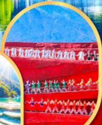
โชว์ Impression Lijiang