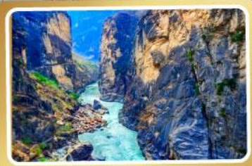
ช่องแคบเสีอกระโจน