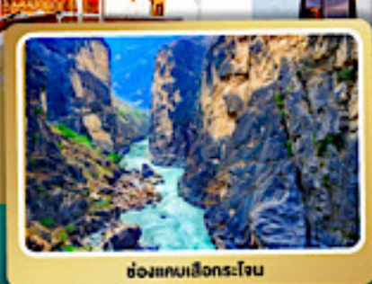
ช่องแคบเลียงกระโจน