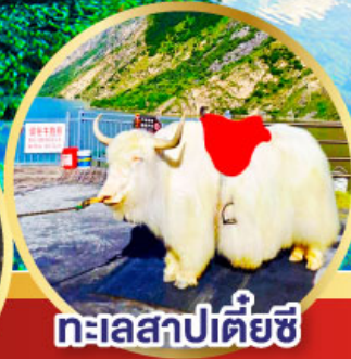
ทะเลสาปเตี้ยซี