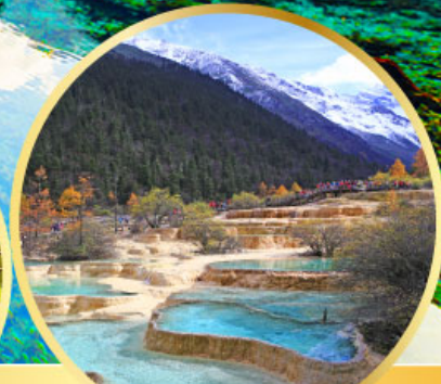
อุทยานหลวง