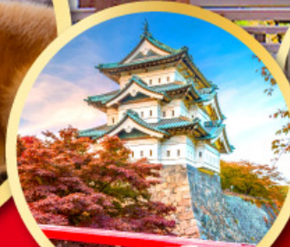
ปราสาทอิโรซากิ