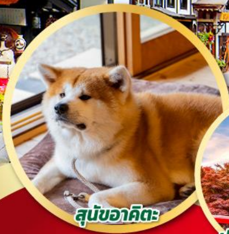
สุนัขอาคิตะ