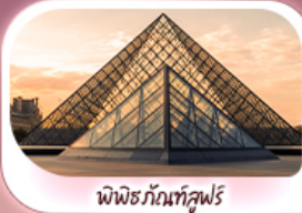
พิพิธภัณฑ์ลูฟร์