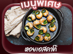
หอยแอสคาทิ