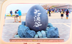
อนุสาวรีย์อิวาคุดานิ

สายการบิน AirAsia X (XJ) น้ำหนักกระเป๋า 20 KG