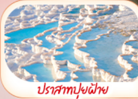
ปราสาทปูยฝ้าย