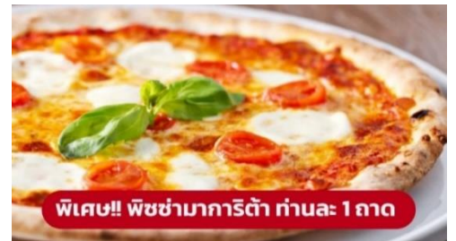
พิเศษ!! พิซซ่ามาการิตต้า ท่านละ 1 ถาด

นำท่านเก็บภาพความประทับใจและถ่ายรูป 1 ใน 7 สิ่งมหัศจรรย์ของโลก หอเอนปิซ่า (Leaning Tower of Pisa) หอเอนปิซ่าที่สร้างขึ้นเพื่อเป็นหอรชังแห่งวิหารประจำเมือง แต่เพียงการเริ่มต้นของการสร้างถึงบริเวณชั้น 3 ก็เกิดการทรุดตัวและต้องหยุดการก่อสร้างจนถัดมาอีก 100 ปี ถึงได้สร้างต่อจนเสร็จสมบูรณ์ มหาวิหารปิซ่า (Cathedral of Pisa) มหาวิหารที่สวยงามที่สุดในลักษณะโรมันเนสส์ แสดงให้เห็นจากชายหอศิลป์กลม กลางตัวมหาวิหาร และขวหอรชัง ตัวมหาวิหารเป็นผังกางเขน มีมุขท้ายวัดและตกแต่งซุ้มโค้งรอบวัดภายนอกเป็นแบบแถบหินอ่อน สลับสีทางขวาง ซึ่งกลายมาเป็นแบบที่เรียกว่า "ลักษณะปิซ่า" และโดมรูปไข่และ Pisa Baptisty of St. John เป็นอาคารทางศาสนาคริสต์นิกายโรมันคาทอลิก จากนั้นนำท่านเดินทางสู่ เมืองมิลาน (Milan) (ระยะทาง 282 กม. / 4 ชั่วโมง)