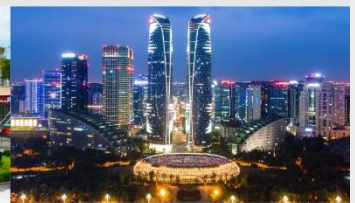
ตึกแฝดเจิงตุ

*ทางบริษัทฯ ขอสงวนสิทธิ์ในการสลับโปรแกรมทัวร์ตามความเหมาะสมขึ้นอยู่กับสถานการณ์หน้างาน โดยคำนึงถึงผลประโยชน์ของลูกค้าเป็นสำคัญ