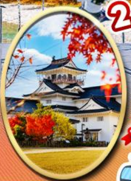
Mikimoto Pearl Island Amaharashi Coast Toyama Castle

เก็บแอปเปิ้ล ณ ภูมิภาค แหล่งปลูก อันดีเยี่ยม ของญี่ปุ่น! 2 ที่เที่ยวแห่งใหม่! NEW จุดชมวิวกว 360° ซิงช้า Cocoru ระเบียง Cocoru นั่งกระเช้าชมวิวไม่เปลี่ยนแปลง NEW Heavens Sonohara ไฮไลท์ พิเศษ! นั่ง 2 กระเช้า พิชิต 2 ภูเขา