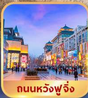
ถนนหวงฟูจิ่ง