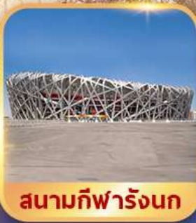
สนามกีฬาρινก