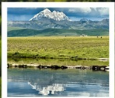
ดวงตาแห่งต่าง

หมู่บ้านทิเบตเจียงจิว • จุดชมวิวกุหลาบหิมะหยา • ปาหล่าง สวนหินปาหล่าง • จุดชมวิวดวงตาแห่งต่าง • วัดมู่หย่า หมู่บ้านเก๋อริ้อหมาซุน • ซินตูเจียง • หมู่บ้านกุ่มงซุน หมู่บ้านปาหล่างเจียงตู • เมืองลอยฟ้าเก๋ดีลามู่ • ภูเขาจ้อตั่วชาน ถนนสายรุ้ง • ทะเลสาบแดง • ถนนคนเดินชอยกวางแคบ