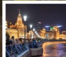
เซี่ยงไฮ้คลาสสิกไนท์

เซี่ยงไฮ้ คลาสสิก ไท่ / 3 ตึกใหญ่แห่งเซี่ยงไฮ้ ล่องเรือหมู่บ้านโบราณจูเจียเจี้ยว / EKA Tianwu / ถนนหอยไผ่ วัดหลงหัวแลนด์มาร์ก จางหยวน / ซินเทียนตี้ / ชมโชว์ ERA ที่โรงละครโด่งดังระดับโลก