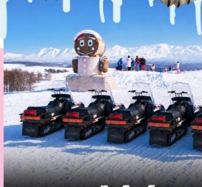
ลานสกีชิโกะโนะโอกะ