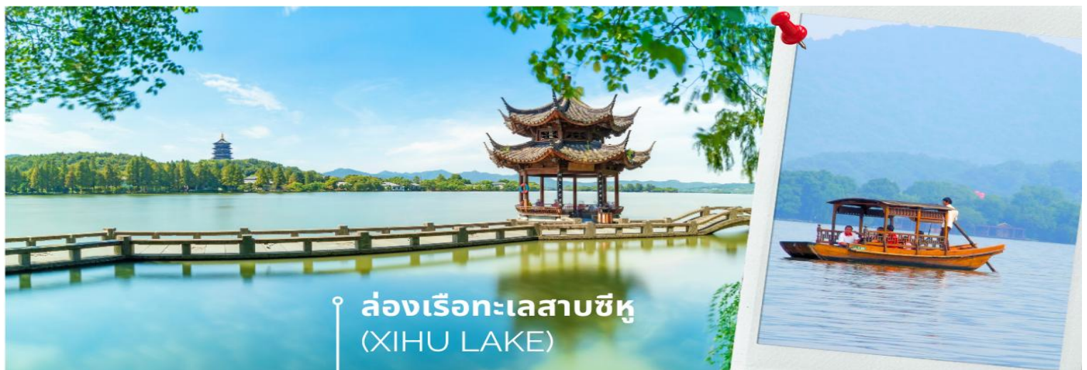
ล่องเรือทะเลสาบซีหู (XIHU LAKE)

นำท่านเดินทางสู่ เมืองหางโจว ใช้เวลาเดินทางประมาณ 2 ชั่วโมง (HANGZHOU) หรือ ฮังโจว เป็นเมืองที่ตั้งอยู่ในประเทศจีน ซึ่งตั้งอยู่ทางตอนตะวันออกของประเทศ เมืองหางโจวเป็นเมืองเก่าแก่ 1 ใน 6 ของประเทศจีน ปัจจุบันหางโจว ถือเป็นเมืองที่อยู่ในเขตภาคตะวันออกที่ได้รับการพัฒนาอย่างสูงสุดแล้ว ดังนั้นหางโจวจึงเป็นที่รู้จักกันเป็นอย่างดีว่าเป็นเมืองที่มีความสำคัญทางเศรษฐกิจ มีวัฒนธรรมที่ยาวนานและเป็นเมืองที่มีทัศนียภาพที่สวยงามเมืองหนึ่งของประเทศจีน นำท่าน ล่องเรือทะเลสาบซีหู (XIHU LAKE) ตั้งอยู่ในเมืองหางโจว ที่นี่สามารถล่องเรือชมความงามของทะเลสาบซีหู นอกจากทิวทัศน์อันงดงามแล้วทะเลสาบแห่งนี้ยังเป็นจุดเริ่มต้นเรื่องราวของ “นางพญางูขาว” ตำนานแห่งความรักสุดยิ่งใหญ่ที่ถูกนำมาทำเป็นภาพยนตร์และละครเวทีที่โด่งดังไปทั่วโลก เมื่อล่องเรือบนทะเลสาบซีหูนอกจากธรรมชาติอันงดงามของทะเลสาบแล้ว สิ่งที่น่าสนใจผู้มาเยือนทะเลสาบแห่งนี้คงหนีไม่พ้น เจดีย์นางพญางูขาว หรือ