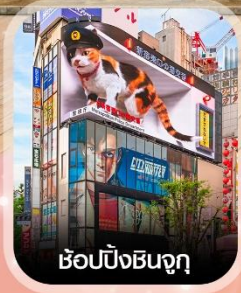
ซ้อปปิ้งชินจูกุ

✈️ คอนเฟิร์ม ออกเดินทาง ทุกพีเรียด 2 ท่านขึ้นไป ✈️