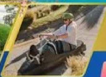
เล่นลuge ที่กรีนสทาวน์

AUCKLAND / ROTORUA / CHRISTCHURCH FOX GLACIER / FRANZ JOSEF / QUEENSTOWN พิกจ็อคแลนด์ 2 คืน / โรโตรัว 1 คืน / พิกคริสตchurch 2 คืน พิกฟรานซ์โจเซฟ 1 คืน / ควีนส์ทาวน์ 2 คืน