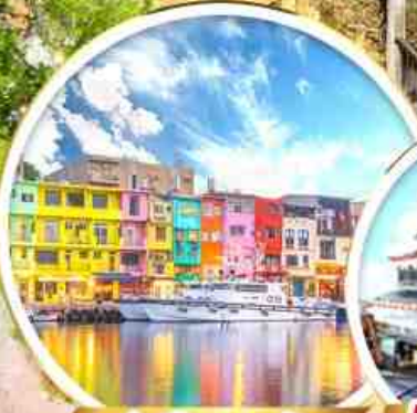
ท่าเรือสายรุ้ง