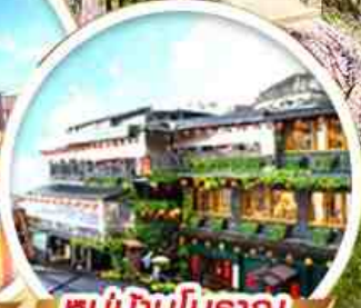
หมู่บ้านโบราณ จิวเฟิน